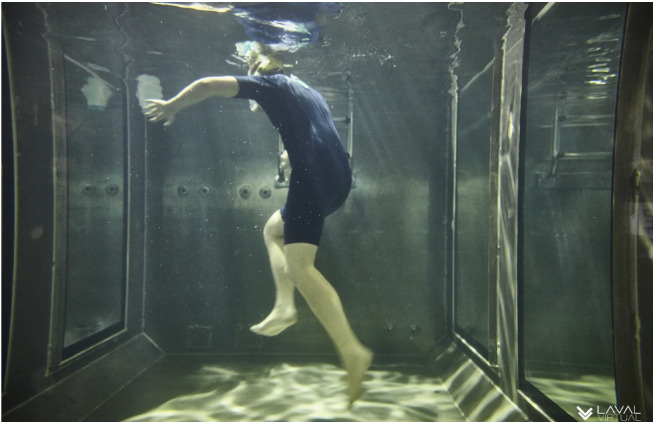
Le projet de The Dolphin Swim Club. Illustration — LAVAL VIRTUAL